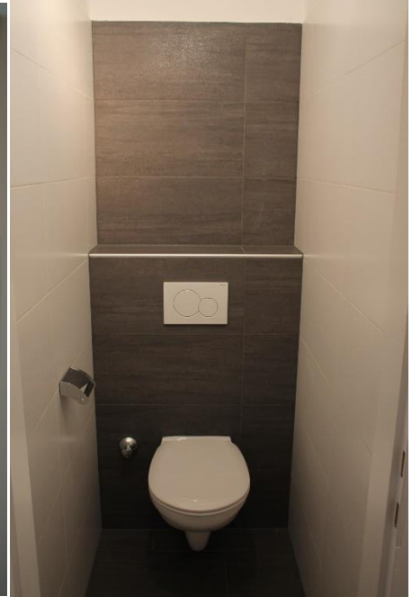
Abbildung 1 WC