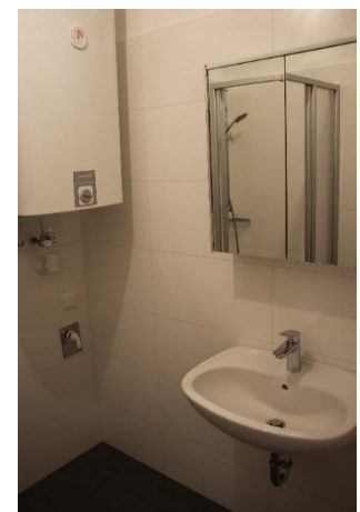
Abbildung 7 Badezimmer

Die Wohnung wurde generalsaniert. Die Anordnung der Zimmer (unmöbliert) ist im Plan ersichtlich. Lift und Kellerraum sind vorhanden. Die Wohnung ist WG-tauglich bzw. eignet sich ideal für ein Paar. Perfekte öffentliche Verkehrsanbindung (Haltestelle der Linie 5 der GKB direkt vor dem Haus). Auch der Fahrradweg verläuft vor dem Haus. Einkaufsmöglichkeiten für den täglichen Bedarf sind fußläufig erreichbar (Lebensmittel, Bank, Apotheke, Ärzte etc.)