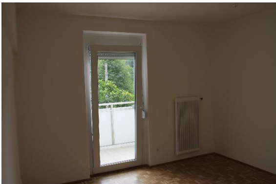
Abbildung 3 Balkonzimmer