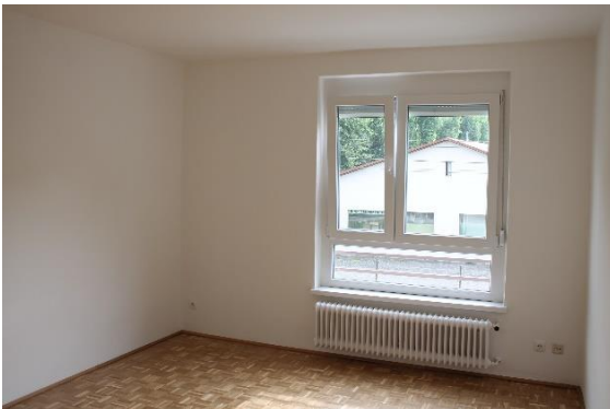
Abbildung 2 Wohnzimmer