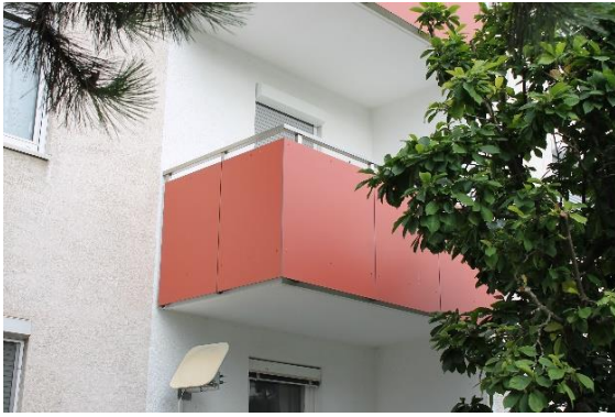
Abbildung 4 Wohnung im 1. Stock, Balkon